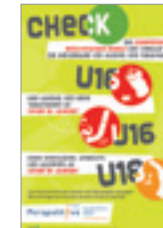
CheckPoint Jugendschutz Plakate, Checklisten, Kleber Alterskontrollscheiben