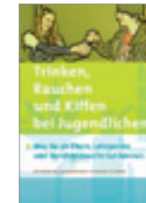
Vorliegende Broschüre A5, 16 Seiten

Die Gratisbestellungen (zuzüglich Porto) gelten nur für den Kanton Thurgau. Bestellungen telefonisch unter 071 626 02 02 oder über ► www.perspektive-tg.ch (Publikationen > Materialbestellung)